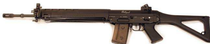
Sturmgewehr 90 heute