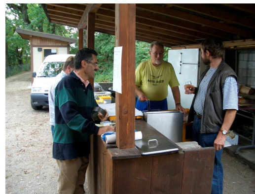
Das dazu gehörende Fischessen