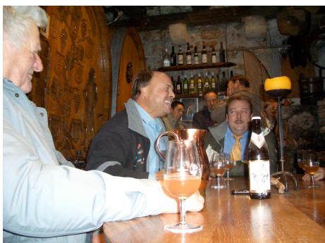
Gemütliches Beisammensein in einem Weinkeller