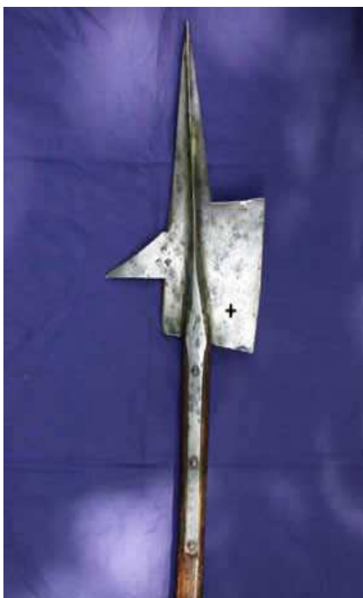
Hellebarte „Hauptwaffe der alten Eidgenossen“

Die im Ancien Regime benutzten Waffen sind uns aus der Literatur bekannt. In der ersten Zeit wurde noch mit der Armbrust geschossen. 1429 schuf die Stadt Bern dann erstmals 15 Handbüchsen Armbrust geschossen. 1429 schuf die Stadt Bern dann erstmals 15 Handbüchsen an, aber die letzten Armbrustschützen verschwanden erst 1558 aus den bernischen Wehrmännerverzeichnissen. 1594 erlaubte die Regierung erstmals die probe – weise Verwendung der Muskete. Diese Waffe wurde bereits 1613 / 14 zur Ordonnanz – Waffe im Bernbiet erklärt und verdrängte alle älteren Handrohre und Büchsen, gleichgültig welcher Ausführung. In der Umfrage von 1614 gab der Landvogt zu Nidau an, dass in Twann und Ligerz je 24 Musketenschützen beheimatet seien. Die gleiche Zahl wurde 1798 bestätigt. Das Total der gesamten ligerzer Mannschaft betrug 1772 immerhin 69 Mann. Diejenigen Infanteristen, die kein eigenes Gewehr besaßen, zogen mit Spiessen und Hellebarten bewaffnet in den Krieg.