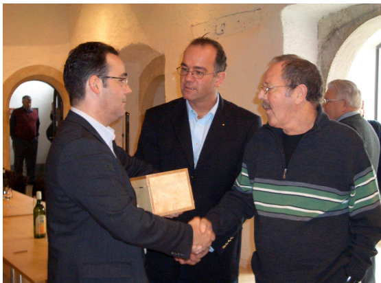
Die Gratulation zum tollen Resultat